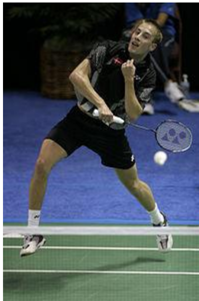
Dánsky olympionik Peter Gade

Bedminton patrí medzi najstaršie športy na svete - prvé doložené záznamy o tomto športe pochádzajú z 7. storočia, keď Číňania hrali hru zvanú Di-Dschian-Dsi . Na podobnom princípe odbíjania operenej loptičky sa v Japonsku hrala hra Cibane a v Kórei sa bedmintonový predchodca nazýval Tiye-Kitcha-Ki . Mimo ázijského kontinentu sa bedmintonu podobné hry hrali medzi Indiánmi Severnej, Strednej a Južnej Ameriky a dokonca aj v stredovekej Európe, kde však časom táto hra upadla do zabudnutia.