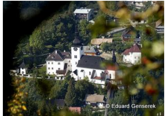
5. miesto - Špania Dolina