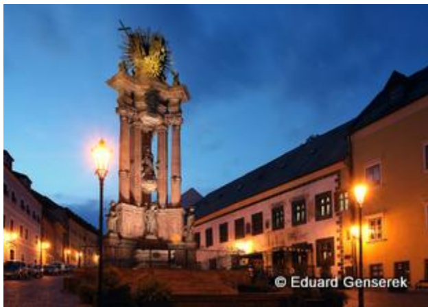
3. miesto - Banská Štiavnica, mesto zapísané v zozname svetového a kultúrneho dedičstva UNESCO