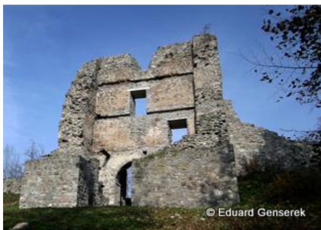
1. miesto - Pustý hrad vo Zvolene

Prečítajte si článok a doplňte, koľko hlasov získali kultúrne a prírodné pamiatky.