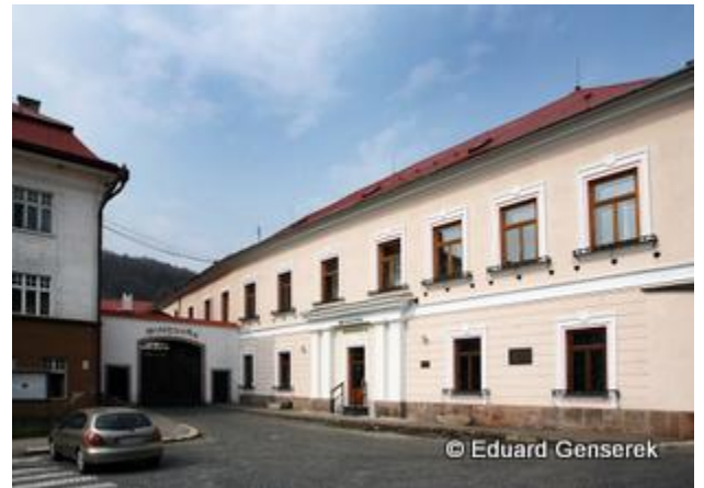
6. miesto - Kremnická mincovňa