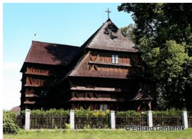
7. miesto - drevený artikulárny kostol a zvonica v Hronseku