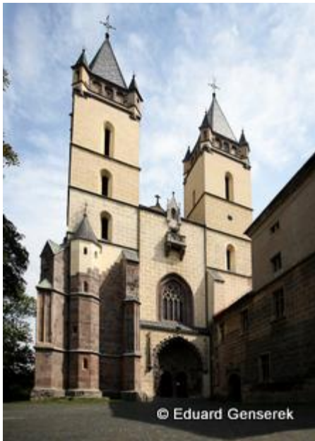
2. miesto - Kláštor v Hronskom Beňadiku